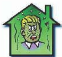
Troubles liés à l'inconfort (santé, comportement)

En revanche, le remplacement des fenêtres anciennes qui laissaient passer l'air par des fenêtres neuves étanches risque de déséquilibrer la ventilation naturelle de votre logement.