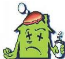
dégradation du logement (humidité, moisissures)

Afin de vous prémunir contre tous ces désagréments et d'éviter les pathologies consécutives à une ventilation insuffisante (odeurs, moisissures, décollement des papiers peints, apparitions d'auréoles humides, condensation sur les murs...), pensez, dès à présent, à prévoir des entrées d'air (dimensionnées et positionnées selon le cahier du CSTB et la fiche technique de l'UF PVC, et, conformes à la réglementation en vigueur) sur vos nouvelles fenêtres dans les pièces principales qui doivent être en adéquation avec les caractéristiques d'isolation acoustique de vos fenêtres.